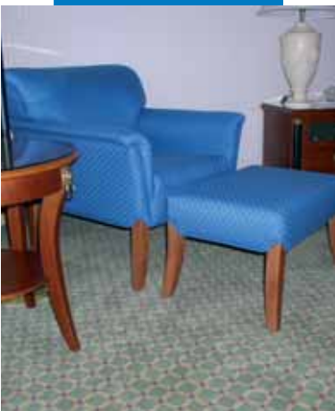
Παράδειγμα χαλιού τοποθετημένου χρησιμοποιώντας Aquacol T - Ξενοδοχείο Marriot - Αυστρία