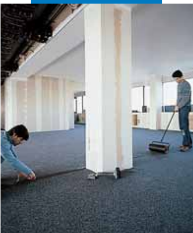
Πίεση των αρμών χαλιού με ρολό