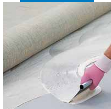
Τοποθέτηση linoleum με Aquacol T