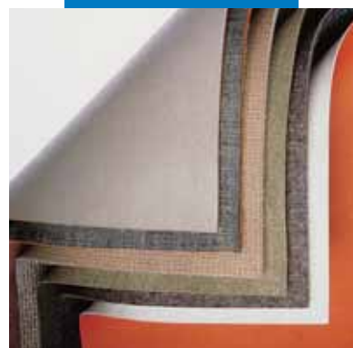
Πλάτες μοκετών που μπορούν να τοποθετηθούν με Aquacol T