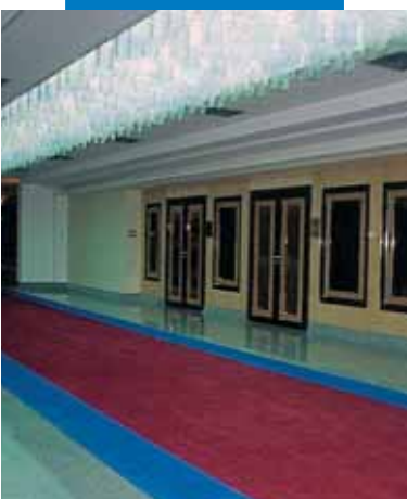
Παράδειγμα τοποθετημένου χαλιού σε διάδρομο δημόσιου κτιρίου - State Ceremonial Palace - Ιταλία