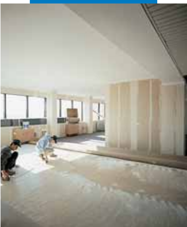
Τοποθέτηση ρολών μεγάλου μεγέθους με Aquacol T