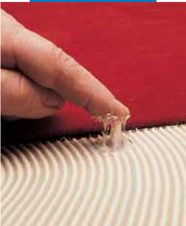
Η "αρχική ικανότητα συγκόλλησης" της Aquacol T

Αποφύγετε την έκθεση της Aquacol T στον παγετό κατά τη διάρκεια της μεταφοράς και της αποθήκευσης και την εκτεταμένη έκθεση της σε θερμοκρασίες μικρότερες των 0°C. Η Aquacol T μπορεί να αποθηκευτεί σε κανονικό περιβάλλον και στην αρχική σφραγισμένη συσκευασία της για 24 μήνες.