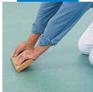
Μάλαξη στον αρμό δαπέδου από linoleum